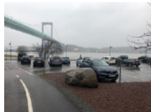
Parkering 100 m