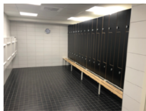
Omklädningsklåp. Tag med hänglås!

Vattengympan börjar igen 23/8 i vår nya bassäng vid Klippan, Vattenkompaniet, Banehagsgatan 10, Hpl Vagnhallarna Majorna, gå under trafikleden mot Klippan ca 300 m